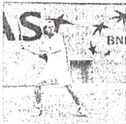
Gustavo Kuerten, treinando em Roland Garros.