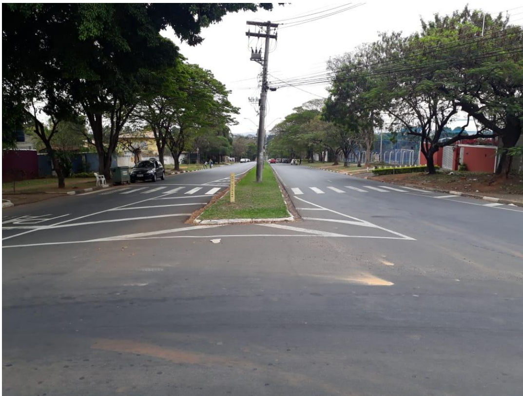
Foto 09: Praça Emílio Marconato - acesso ao Distrito Industrial de Jaguariúna e à Rod. SP-340