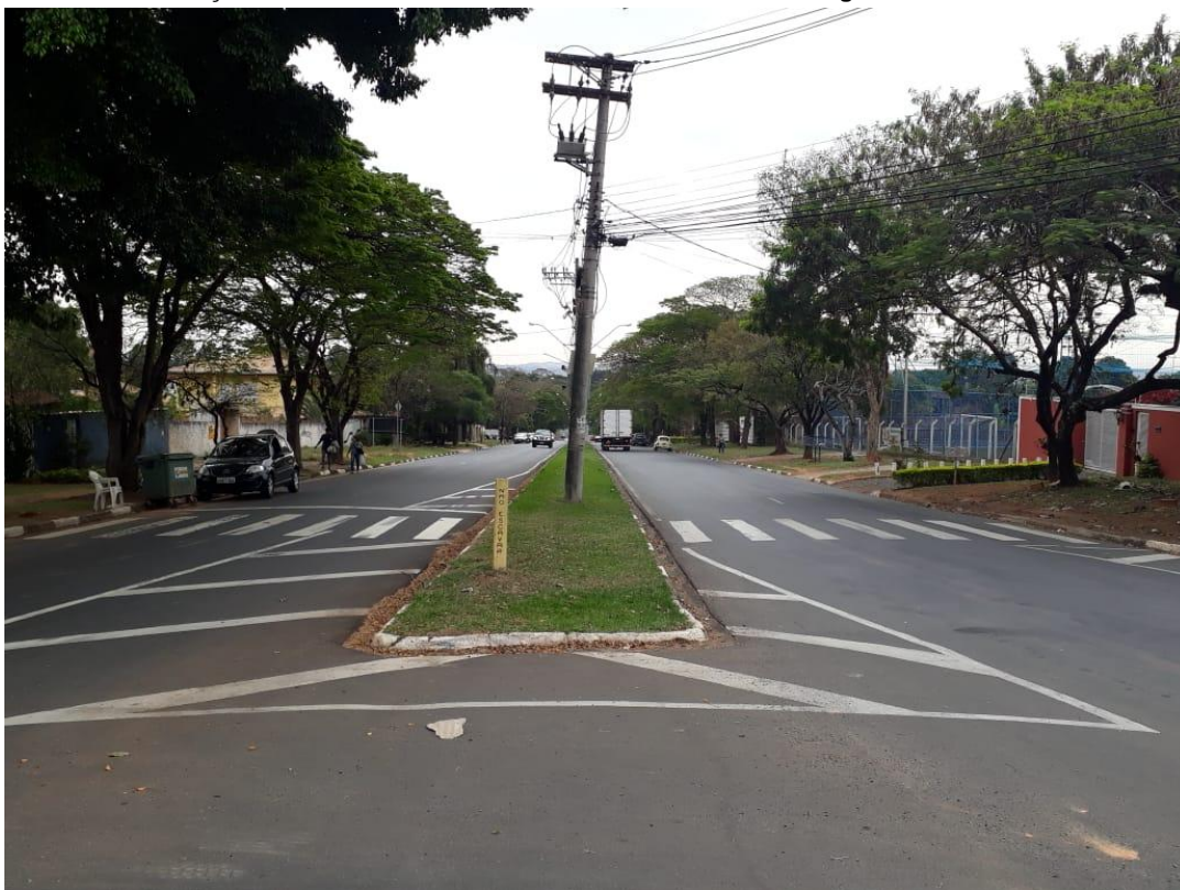
Foto 10: Praça Emílio Marconato - acesso ao Distrito Industrial de Jaguariúna e à Rod. SP-340