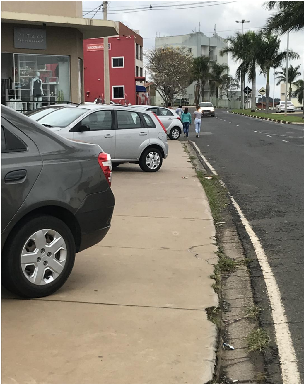
Foto 04: Av. Antônio Pinto Catão (veículos na calçada e pessoas andando na avenida)