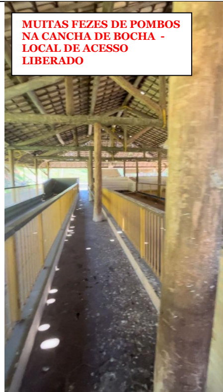
MUITAS FEZES DE POMBOS NA CANCHA DE BOCHA - LOCAL DE ACESSO LIBERADO