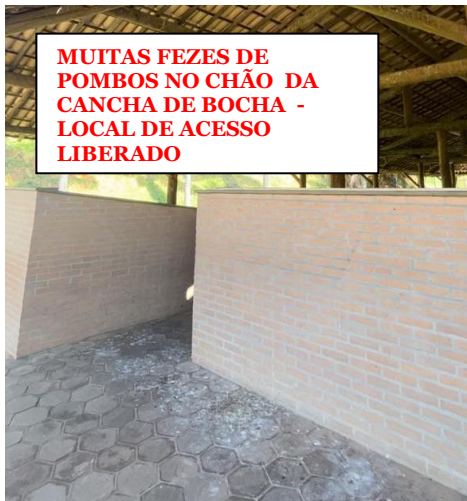
MUITAS FEZES DE POMBOS NO CHÃO DA CANCHA DE BOCHA - LOCAL DE ACESSO LIBERADO