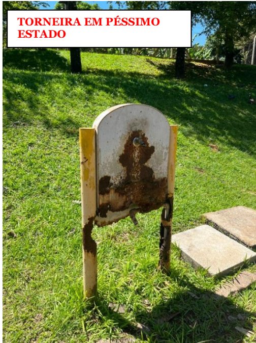
TORNEIRA EM PÉSSIMO ESTADO