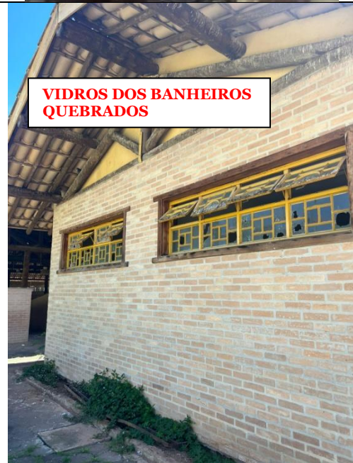
VIDROS DOS BANHEIROS QUEBRADOS